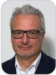
Associé - Gérant