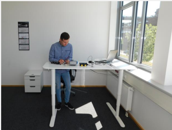
Salle de benchmarking

En mai 2018, PGUB Management Consultants GmbH de Dortmund (TZDO - Phoenix West) a emménagé deux nouvelles salles, un bureau de benchmarking et un autre bureau.